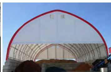
HP600 60' x 96' - 12' Sciure de bois, bio- masse et paillis