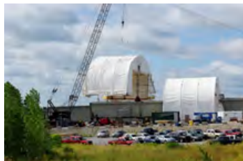
S700 50' x 39' - 13' Déplacement Aérien - assemblage modulaire