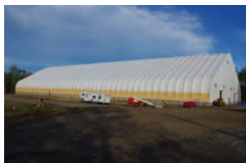
S700 140' x 368' - 8' Centre de motocross intérieur