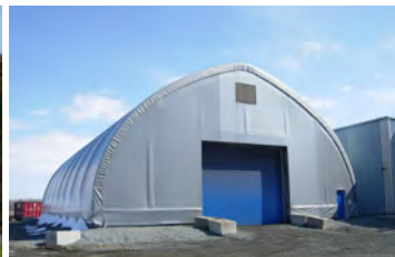
HP600 60' x 92' - 12'