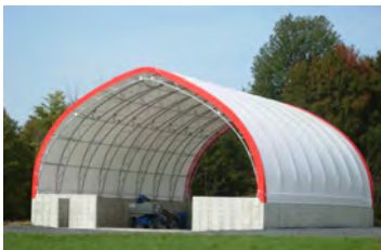
HP600 60' x 96' - 12'