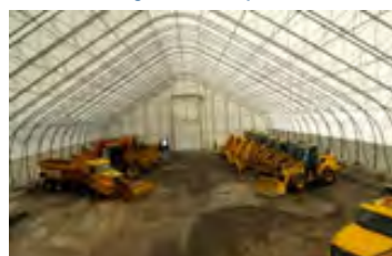
S700 105' x 200' Abri équipement de voirie 45' de haut