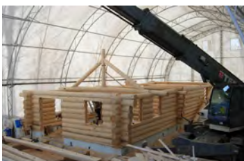
VHP600 50' x 90 - 15' Construction maison bois ronds