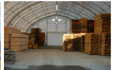
HP600 72' x 108' - 12' Entrepôt pour moulures de bois