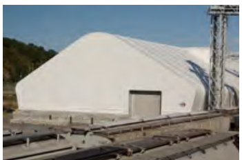
S700 90' x 202' - 10' Entrepôt vrac