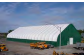
S700 105' x 200'