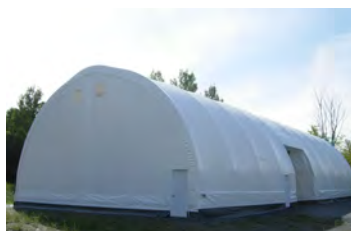
HP 600 50' x 100' - 10 Porte sur côté Entrepôt général