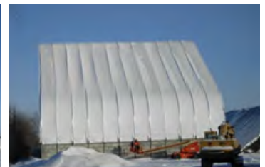
S700 160' x 96' - 8' Vue de côté 70' de haut