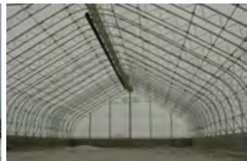
S700 120' x 240' - 12' Entrepôt pour chaux de magnésium