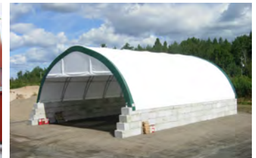
LP600 50' x 72' - 12' Entrepôt pour sel