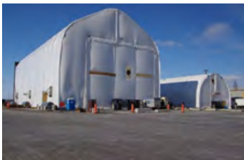
S700 80' x 156' - 12' Hauteur 70'