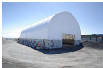
VHP600 70' x 120' - 8' Recyclage asphalte