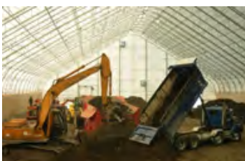
S700 140' x 368' - 8' X-TOWN- Vue durant les travaux