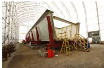
S700 80' x 156' - 12' Assemblage des travées de l'autoroute 30