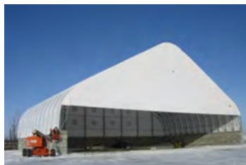
S700 160' x 96' - 8' Abri à agrégat grande capacité