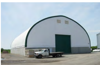
VHP600 80' x 130' - 10' Entrepôt pour engrais minéralisés