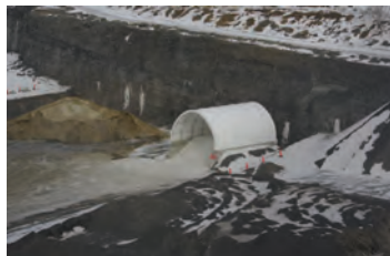
HP600 40' x 60 Entrepôt de sel