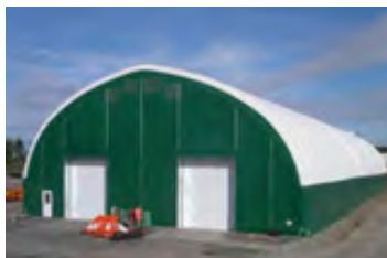
VHP600 80' x 80' - 12' Façade 2 portes 16' x 16' côte à côte