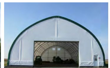
HP600 60' x 132' Entrepôt machinerie