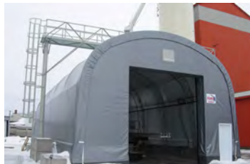
S300 30' x 60' - 12' Protection pour chargement