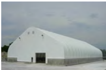
S700 120' x 240' - 12' Fondation de 8' de haut 58' de hauteur totale