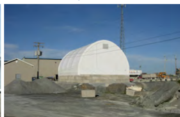
HP 600 40' x 48' - 12' Bâtiment pour lavage des équipements