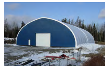
HP600 80' x 120' - 10' 1 Porte 16' x 16'