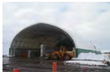
VHP 80' x 80' - 8' Abris à abrasif (Lévis)