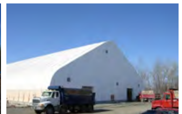
S700 140' x 368' - 8' Hauteur de 60'