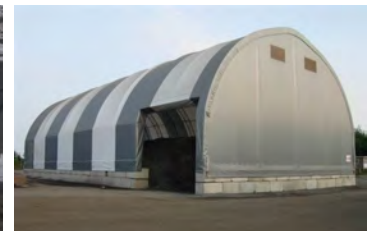
HP600 50' x 100' - 10' Entrepôt de minerais